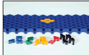
Logonapit jaguar tuulikaappimatolle